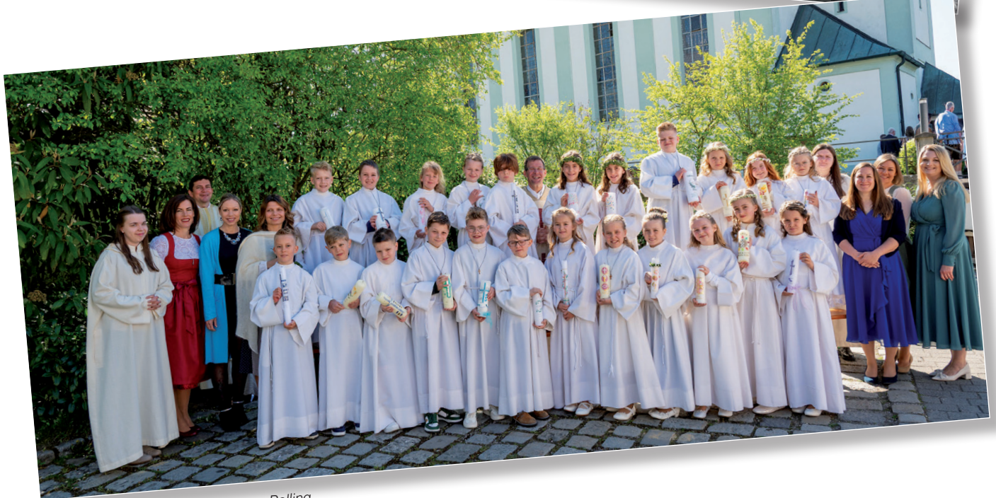
Gruppenfoto Flossing – Polling