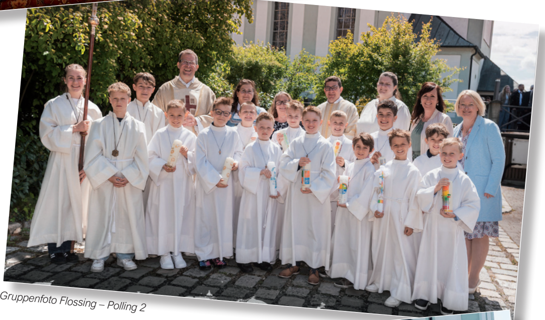
Gruppenfoto Flossing – Polling 2