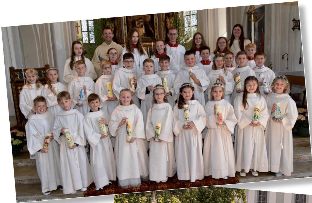
Gruppenfoto Taufkirchen – Oberneukirchen